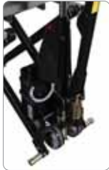
400 mm in altında transpalet olarak görev yapar.