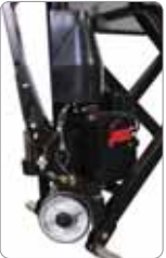
200 kg.'a kadar olan yükleri "hızlı kaldırma" fonksiyonu ile daha hızlı kaldırır.