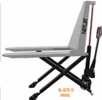
NL-HLTN 10 MANUEL