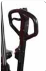
Akülü modellerde yer alan anahtar