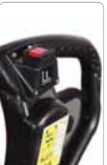
Akü ile kaldırma işlemi artık daha kolay ve hızlı