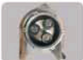
Planet Dişli Sistemi