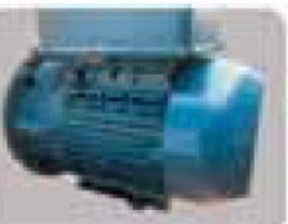
WEG Elektrik Motoru

Planet dişli sistemi yüksek hassasiyet ve yüksek tork ile sorunsuz çalışma ve düşük gürültü seviyesine sahiptir.