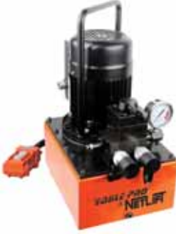
EPB -171A (3B5P5A)