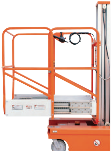
Opsiyonel / Optional: Genişletilmiş platform/ Extended platform