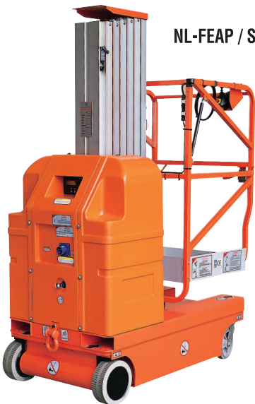
NL-FEAP / S