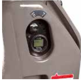
GÖSTERGE (çalışma saati ve akü şarj durumu) INDICATOR (operation hour and charge level)