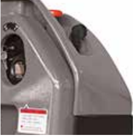
DAHİLİ ŞARJ CİHAZI INTERNAL CHARGER