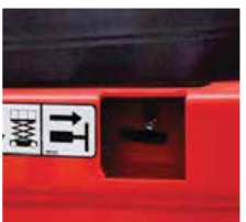
Acil Durum İndirme Sistemi