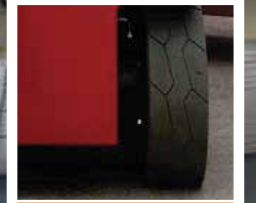
Otomatik Fren Sistemi