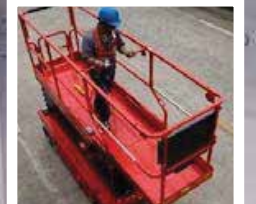
Tek yönlü platform uzatma