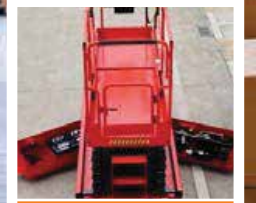
Tüm komponentlere kolay erişim