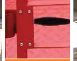
Otomatik Kilitlenen Platform Kapısı