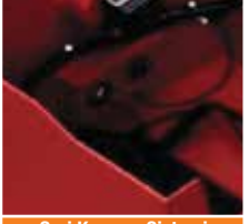
Şarj Koruma Sistemi Akü dolunca otomatik olarak şarjı sonlandırır