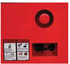
Ana Güç Anahtarı Park halinde kapalı tutulmalıdır