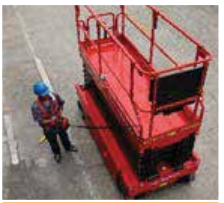
Kablolu joystick kumanda