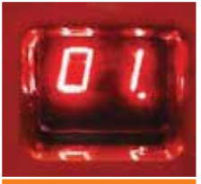
Hata kodu göstergesi