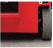
İz Bırakmayan Teker